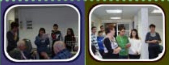
הדלקת נרות חנוכה בבית הקשיש