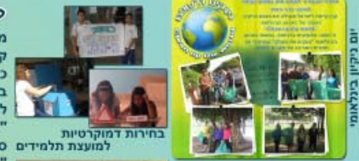
בחירות דמוקרטיות למועצת תלמידים

תל"י - תגבור לימודי יהדות בשכבות ז'-ט'. חמ"ד חינוך למדעים ע"י סטודנטים מהסניפון. "טבע הכימיה" בשיתוף חברת טבע.