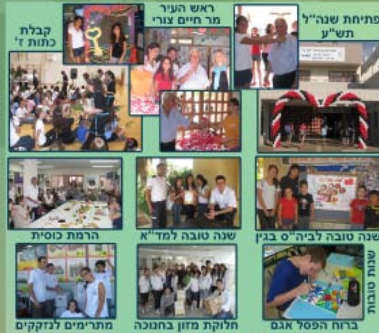
מנהיגות ביה"ס בפעילות ענפה