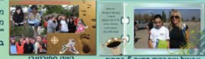
אביטל וייסברוד מקום 5 במחוז ניווט ספורטיבי