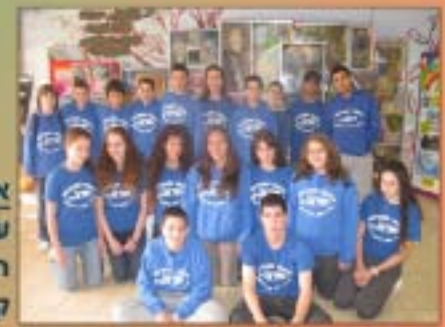
קבוצת אורטכניון ח' תש"ע

אורטכניון: תגבור לימודי במתמטיקה ואנגלית ערב הורים. הצגת תוכנית לימודים. התמודדות עם לחץ לימודי, תכנון זמן, אחריות והתבגרות, בהנחיית יועצת השכבה. קורס הכנה ללימודים אקדמיים בטכניון: מיומנויות אקדמיות, חשיבה לוגית וחקר מדעי. תחרות טל"מ במתמטיקה בטכניון.