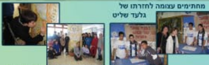
החתמת שכבת ז' על לוח גלעד