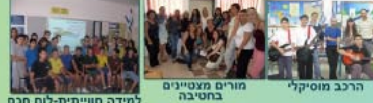
הרכב מוסיקלי מורים מצטיינים בחטיבה למידה חווייתית-לוח חכם