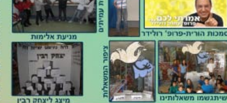
מייצג ליצחק רבין