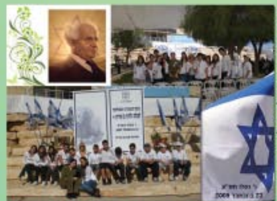
בטקס אזכרה ממלכתי לזכר בני-גוריון

"אומנות בין דורית"-סיום הקמת גן פסלים בפאטיי בנושא: "תקשורת בינאישית" בשיתוף תלמידים, מורים, הורים, קשישים ואנשי קהילה.