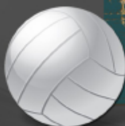
במהלך משחק כדוריד