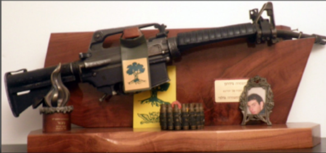
נשקו של אבישי M16

מפאת העובדה שאבישי לא היה בין אלו שהתרכזו עם המסוק, נשקו נותר שלם.