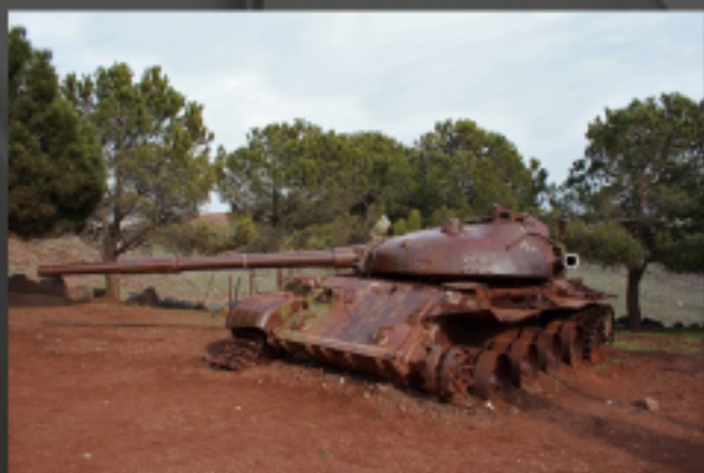
הטנק הסורי באתר

במושב "נתיב השירה" הוקמה ספרייה על שמו על עוזי, הפועלת עד היום.