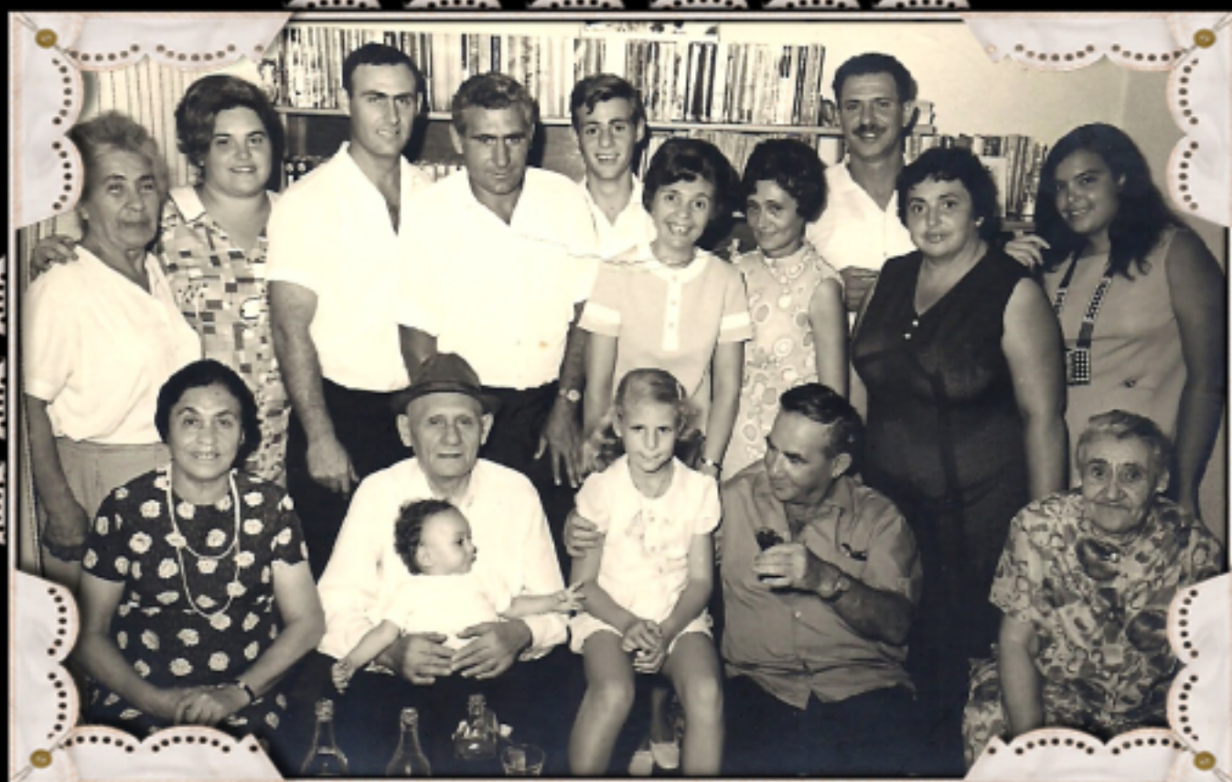
יום הולדת שנה לאילן בחיק המשפחה המורחבת

אני הייתי מאוד תלויה באבא הוא גידל אותי - כך הוא היה אומר לי תמיד, משום שהייתי צעירה ממנו בעשר שנים ושלושה חודשים. עשינו לך יום הולדת בגיל שנה וכולם באו, עשינו תמונות והיה נהדר. זה היה בחודש ספטמבר.