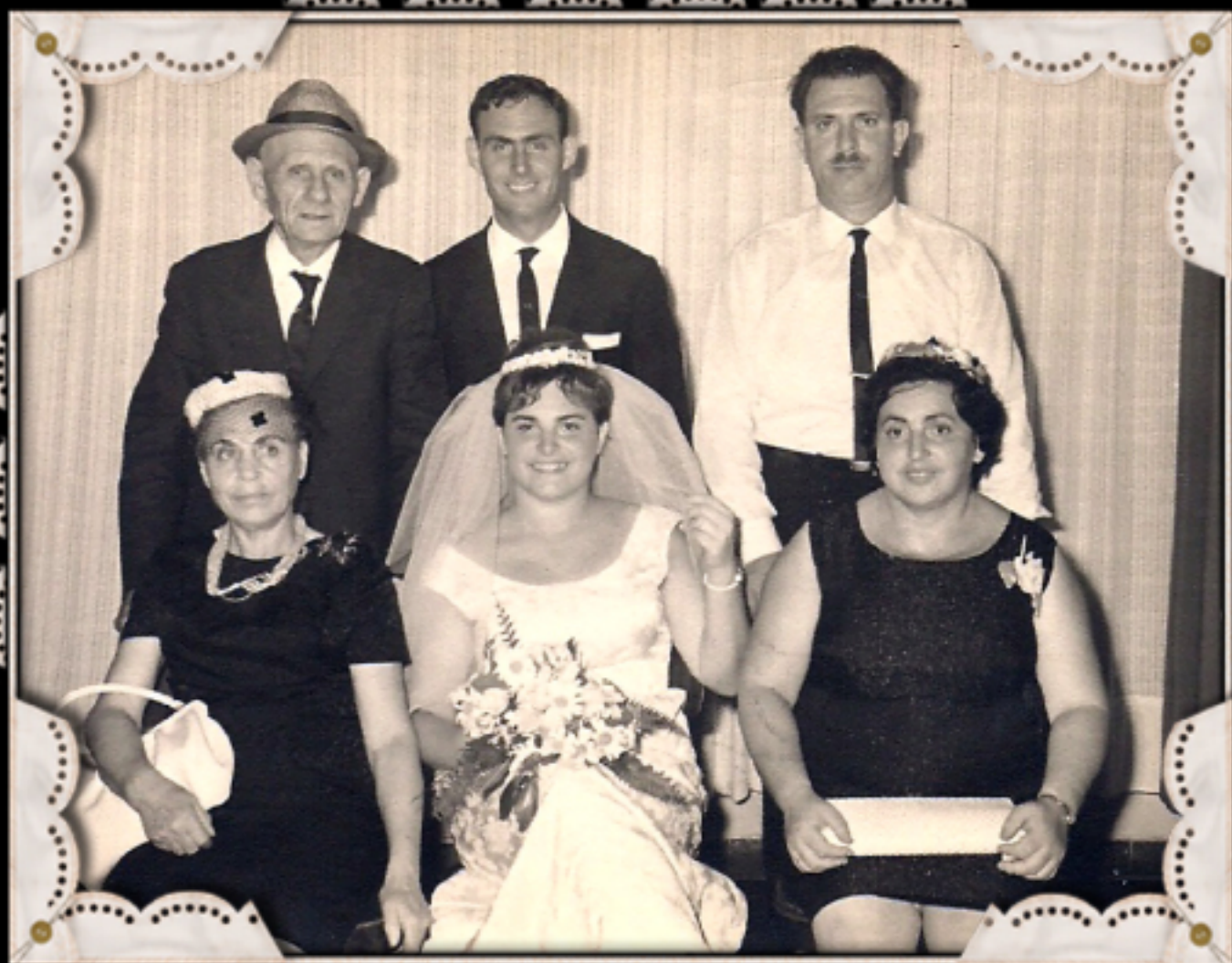
הזוג הצעיר והוריהם