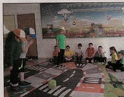
פעילות נושא הזהירות בדרכים בביה"ס אלמוגים בקריית ים.

כמטרה להגביר את מודעות התלמידים וההורים לנושא הזהירות בדרכים