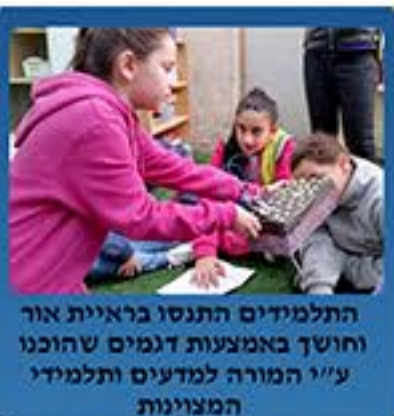
התלמידים התנסו בראיית אור וחושך באמצעות דגמים שהוכנו ע"י המורה למדעים ותלמידי המצוינות