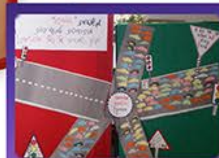
הורי התלמידים חותמים על אמנת זה"ב