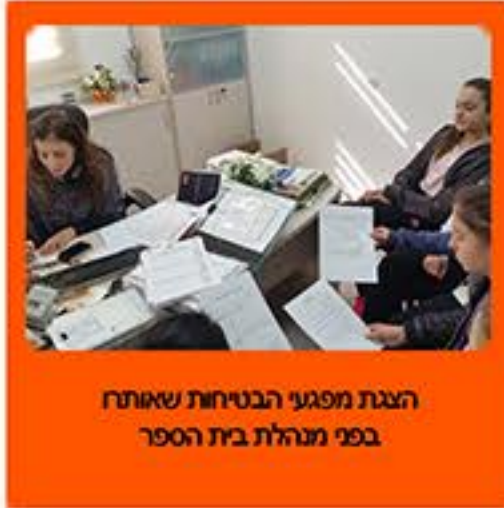
הצגת מפגעי הבטיחות שאותרו בפני מנהלת בית הספר