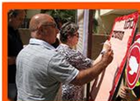
סבים וסבתות חותמים על אמנת זה"ב