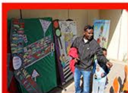
הורי התלמידים חותמים על אמנת זה"ב באמצעות חסות הבטיחות