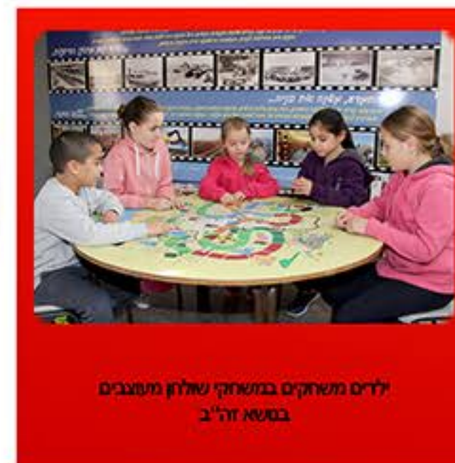
ילדים משחקים במשחקי שולחן מעוצבים בנושא זה"ב

משחק זהירות בדרכים בגרסת מעברי חצייה וכבישים