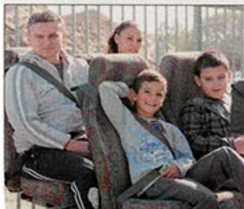
הורים וילדים בתחנת הסימולטור "המשכנע האנושי".

על אחר מביטאות המיתקן תגורים כתגורת בטיחות באופן נכון ובטיחותי והתגוס בכלימה כטוחה, כך הבינו את משמעות השיבות תגורת הבטיחות.