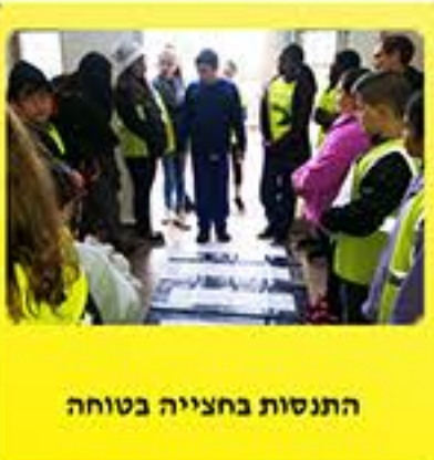
התנסות בחצייה בטוחה