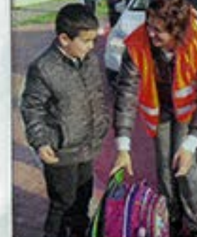
מיום החזרות בדרכים "נשק וסע" כטנטי ביה"ס אלמוגים.