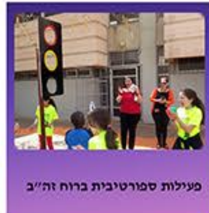
פעילות ספורטיבית ברוח זה"ב