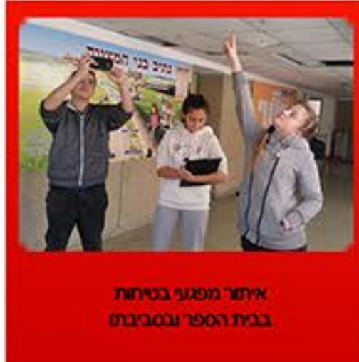
איתור מפגעי בטיחות בבית הספר ובסביבתו