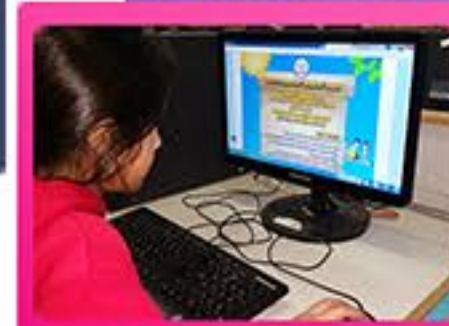
חתימה מקוונת במחשב