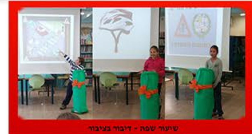
שיעור סופי - דיבור בציבור