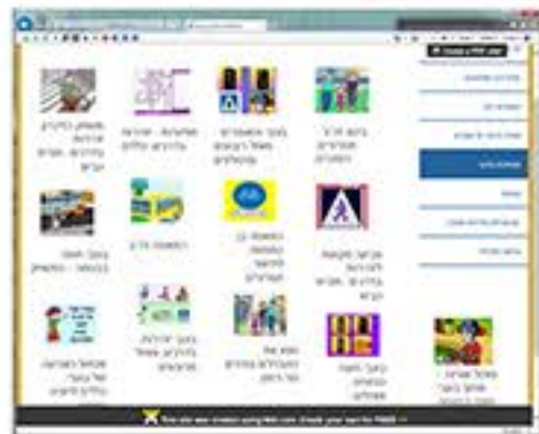
מתוך אתר זה"ב בית ספרי