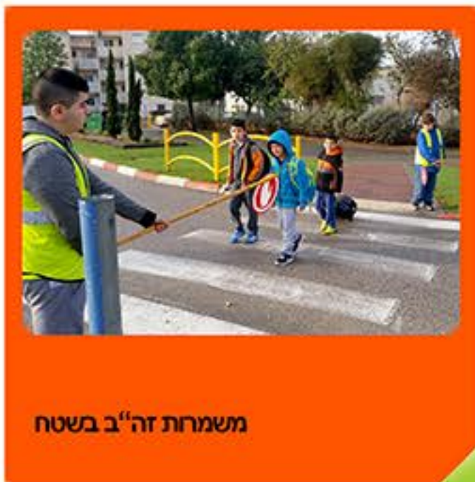
משמרות זה"ב בשטח