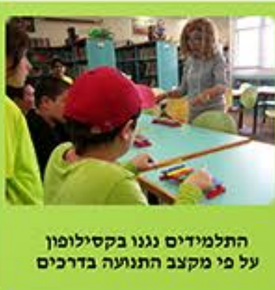
התלמידים נגנו בקסילופון על פי מקצב התנועה בדרכים