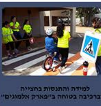
למידה והתנסות בחצייה וברכיבה בטוחה ב"פארק אלמוגים"