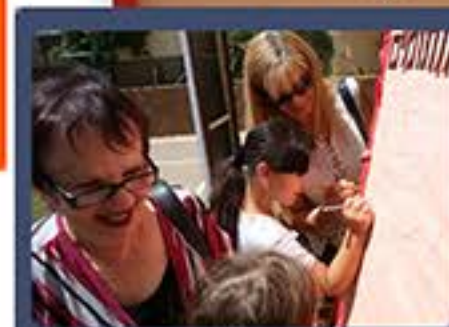
סבים וסבתות חותמים על אמנת זה"ב