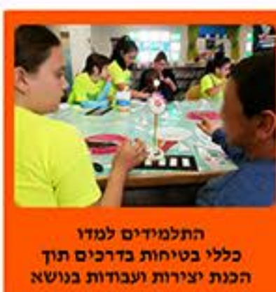
התלמידים למדו כללי בטיחות בדרכים תוך הכנת יצירות ועבודות בנושא