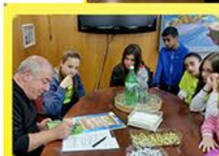
ראש העיר חותם על האמנה