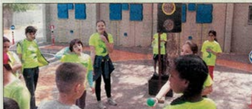
יום פעילות בחצר ביה"ס אלמוגים לציון היום הבינלאומי להזהירות בדרכים.

יום פעילות משותף לתלמידי ביה"ס אלמוגים וביה"ס צליל ים לחינוך המיוחד