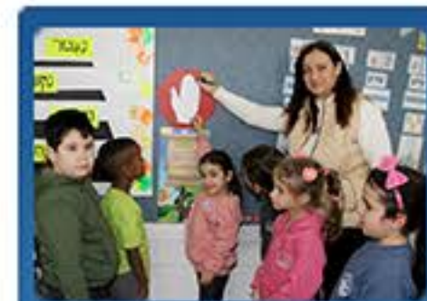
חתימה בכיתות עם המורה