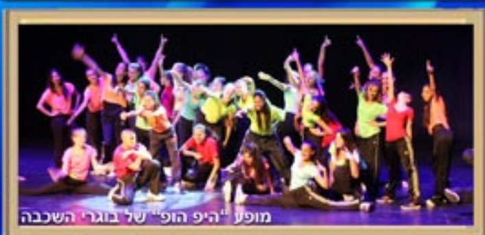
מופע "היפ הופ" של בוגרי השכבה