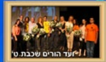
צעד הורים שכבת ט'