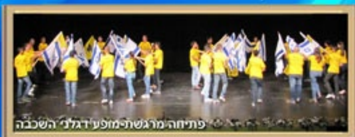
פתיחה מרגשת למופע דגלני השכבה

שימור מורשת יוני, בא לידי ביטוי, בתעודות ההערכה וההצטיינות שחולקו בערב זה בתחומי הלימודים, אהבת הארץ, התנדבות בקהילה, ספורט, של"ח, הצטיינות בלימודים ועוד. הטקס נפתח במופע דגלנים מרהיב ומרגש. התלמידים הנחו את הטקס במקצועיות, תוך שימת דגש על חוויות שחוו בין כתלי בית הספר, שבאמצעותם השפילו להראות את הקשר ותחושת השייכות לחטיבה. התלמידים הצדיעו ונפרדו מכל המורים שהגיעו לכבוד ולהיפרד.