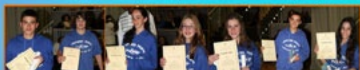
סיימו קורס עבודות חוקר