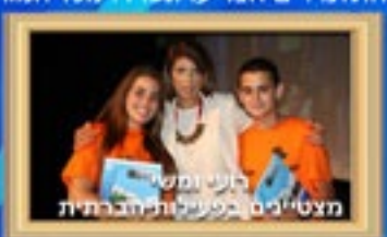
הנשיא ומס' מצטיינים בפעילות חברתית