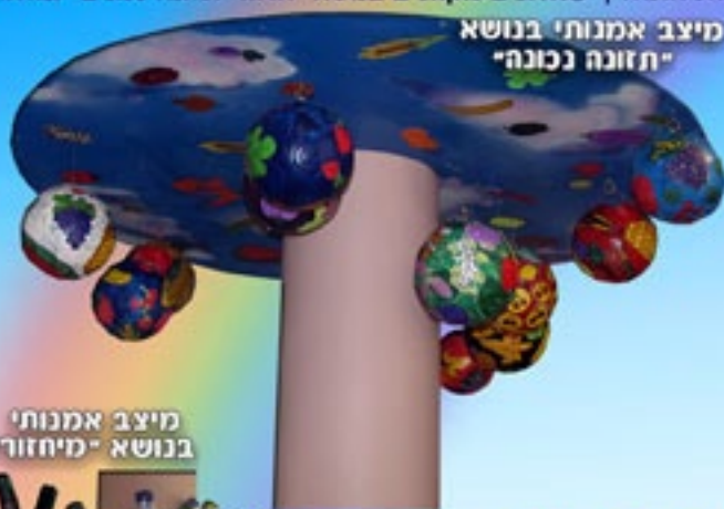
מיצב אמנותי בנושא "מיחזור"