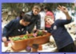
שילוב מעגלים מועצות תלמידים יונתן ובתי"ס היסודיים

בפורים הבאנו את "שמחת החג" לילדים המאושפזים ברמב"ם. ביום ההורים, ארגנו את "יומנתן", מסורת בית ספרית, והשנה בסימן "אורח חיים בריא ופעיל". השתתפנו בקבלת שבת ב"אולפנה סגולה" בסימן מפגש בין חילוניים לדתיים. בפסח אספנו בגדים וצעצועים תרומת כל תלמידי החטיבה לעמותת "חסד". אירחנו "שילבנו ידיים" עם נציגי מועצות היסודיים. במהלך השנה נפגשנו עם מנהלת החטיבה לקידום פרויקטים חינוכיים וחברתיים ותמיד התקבלנו בשמחה. בסיום השנה הוקרנו את מורנו ב"ארוחת בריאות מפנקת" לאות תודה והוקרה על שנה מדהימה. אנו מאחלים לכם חופשה נעימה ומהנה!