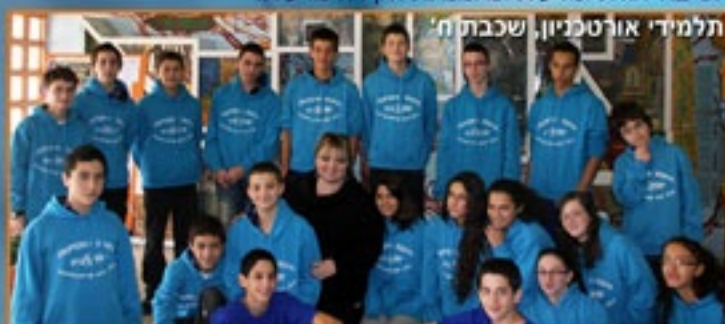
תלמידי אורטכניון, שכבת ח'

תלמידי "אורטכניון" אלופים גם במגוון סוגי ספורט