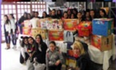
ביקור ילדים חולים בביה"ח רמב"ם