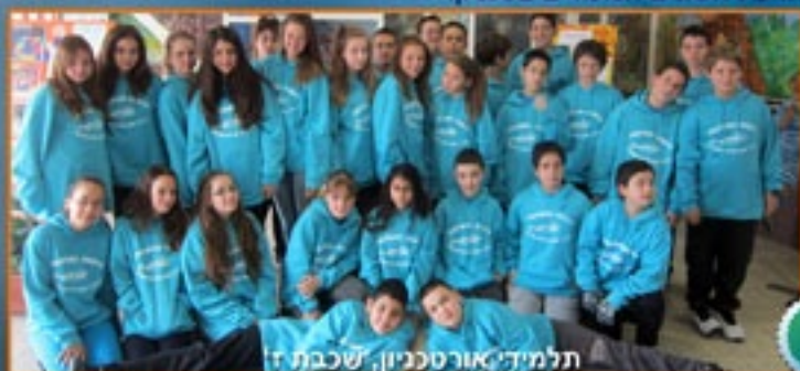
תלמידי אורטכניון, שכבת ז'

סיימו שנת לימודים ראשונה, במהלכה נחשפו לתחומים השונים הנלמדים בטכניון. הם חוו סידרה של 7 מפגשים לימודיים, במהלכם נחשפו לתחומי הדעת השונים הנלמדים בטכניון.