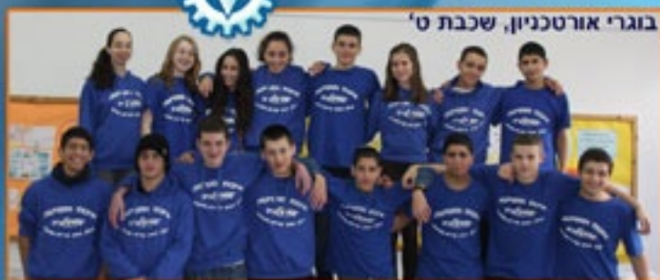
בוגרי אורטכניון, שכבת ט'

סיימו שלוש שנות לימודים בחטיבה. בטקס מרגש שנערך בטכניון הציגו התלמידים את עבודות החקר שהכינו. בימים אלה חלקם חובק את פסלי האקדמיה כסטודנטים מן המניין בקורס "ביולוגיה 1", קורס אקדמי ראשון, המועבר ע"י פרופ' גפשטיין מהטכניון. בקורס זה יצברו השנה נקודות לתואר הראשון.