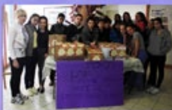
מביאים את שמחת החג לעמותת "חסד"