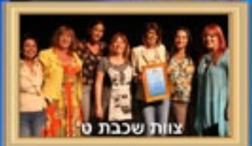
צוות שכבת ט'