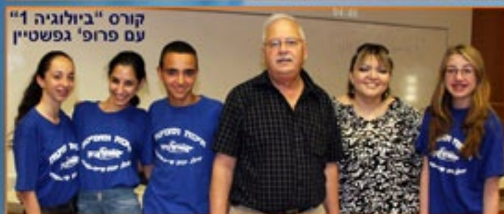
קורס "ביולוגיה 1" עם פרופ' גפשטיין