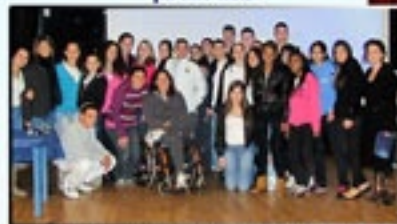
הרצאה "השאיפה למצוינות" קרן ליבוביץ