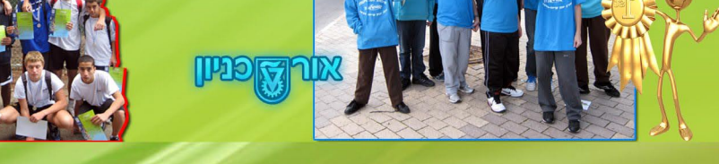
אולימפיאדת מתמטיקה במכון ויצמן לקראת אולימפיאדה בינלאומית