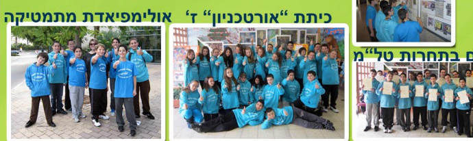
כיתת "אורטכניון" ז' אולימפיאדת מתמטיקה

* מתמטיקה: פיתוח חשיבה עצמאית, יכולת ניתוח ופתרון בעיות, שילוב משחקי חשיבה ואסטרטגיה מתמטית, חידות מתמטיות. * מדעים: חקר תופעות מדעיות, ניסויים ותצפיות. * טיפוח מנהיגות במצוינות: מלמדים מדע בגני הילדים. * חשיבה מדעית: ערב הורים ותלמידים, חקר תכונות "הקרח היבש" לעומת קרח מים, חוויה מדעית לכולם. * "סדנת טיסנים" - עקרונות התעופה, הכוחות הפועלים, מבנה כנף הציפור, בניית טיסנים, טיסן דמוי ציפור וטיסן דמוי מטוס והטסתם. * "חוקרים את להבת הנר" - חידות חשיבה, מהו אור? מאיזה חומר עשוי הפתיל? היכרות עם חנוכייה כימית. * "ברוזים בכפר" - סיור לימודי ב"כפר ברוך": ביקור במדגרה, התפתחות האפרוח. תערוכות בולים