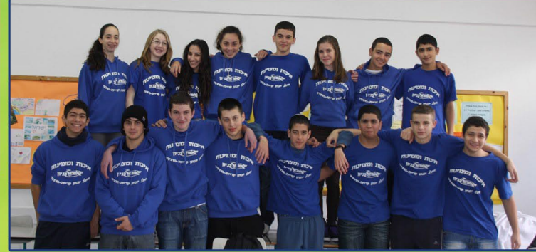
כיתת "אורטכניון" ט'

מדעים-העשרה-הרצאות וספורים לימודיים * הרצאה "תזונה נבונה" מפי תזונאית בכירה-"חשיבות הכושר הגופני", "גסטרונוגיה". * סיורים-בסימן התערבות האדם-כרם מהר"ל-מיחזור ושימוש חוזר, של מים וחומרים שונים. * "חי בר" כרמל-שריפה בכרמל שימור מינים והשבה לטבע. * סיור למכון לחקר ימים ואגמים.