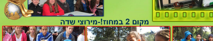
יום הורים ב"סימן האור"