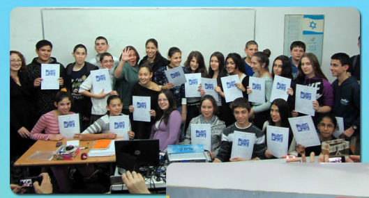
ערב סיום פרויקט מיכ"ל