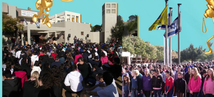
בחירות למועצת תלמידים