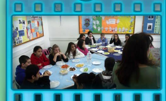
יום הורים ב"סימן האור"