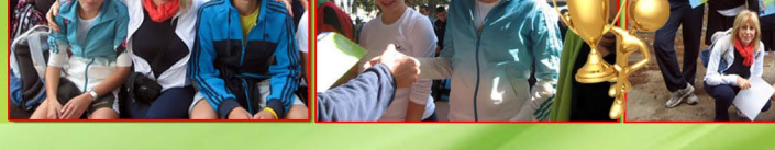
יום הורים ב"סימן האור"

* צמצום כמות התלמידים בכיתות ז', ח', ט'. * בשכבות ז' ו-ח': שתי מחנכות-"חינוכאיות" לכל כתה. * קבוצות לימוד קטנות במקצועות הליבה: מתמטיקה, אנגלית, הבעה ומדעים. * מיפוי הישגים לימודיים ככלי לשיפור הישגים לימודיים בכל השכבות ופתיחת מערכי תגבור. * "שמורת הישגים"-במימון הרשות המקומית. * "שעות פרטניות"-תגבור לימודי בקבוצות קטנות ע"י צוות המורים. * המטרה: תרומה לאקלים כיתתי ובית ספרי, קירוב לבבות בין מורים לתלמידים. הגברת תחושת המסוגלות האישית של תלמידים, חיזוק במקצועות הליבה, אתגור תלמידים, יצירת חווית למידה שונה ושיפור הישגים לימודיים. * "אקד"מ=(אוריינות, קהילה לומדת, דיאלוג מתמיד) בשכבת כיתות ז'-שיפור הישגים ו"שיח מקדם" בין מורה לתלמיד, לחיזוק תחושת המסוגלות העצמית, תחושת השייכות ותחושת האוטונומיה של התלמיד. * "עידוד הקריאה"-קריאה מונחית בכל הכתות בשעורי ספרות. * "שמחת הקריאה"-חשיפה לסופרים וספרים. * "חידון תנ"ך"-היערכות לחידון במחוז חיפה. * "פרחי רפאל"-תגבור לימודי מתמטיקה לתלמידים טובים, ע"י מהנדסי רפאל בשעות אחה"צ (שכבת ח'). * תגבור לעולים חדשים ע"י חילות. * "פרוייקט מיכאל"-מיצוי כישורי למידה, אסטרטגיה וצמיחה אישית בשעות אחה"צ לתלמידים נבחרים. * אתר ביה"ס כפלטפורמה ללמידה ולתקשורת בינאישית. * "לוחות חכמים אינטראקטיביים וברקואים" בכל כתות הלימוד בחטיבה. * עידוד חשיבות לימודי השפה הערבית-הרצאות מטעם חיל מודיעין בכל השכבות-תוכנית לימודים חדשה.