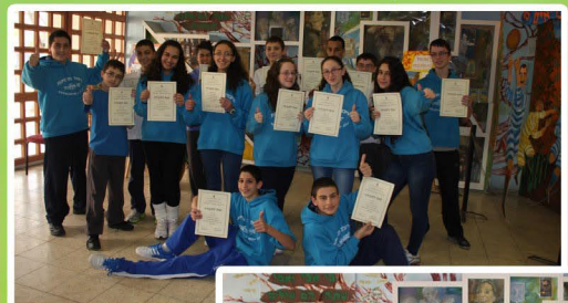
הזוכים בתחרות טל"מ, מתמטיקה בטכניון

"מועדון חלל" חקר החלל-היכרות עם מערכת השמש והכוכב "שמש"-מבנה ותהליכים, התחממות גלובלית של כדור הארץ. תופעות והשפעותיהן.