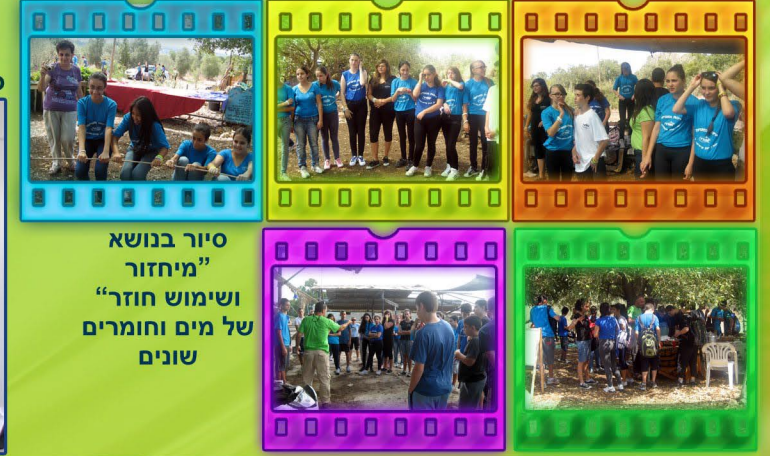
סיור בנושא "מיחזור ושימוש חוזר" של מים וחומרים שונים

מדעים-העשרה-הרצאות וספורים לימודיים * הרצאה "תזונה נבונה" מפי תזונאית בכירה-"חשיבות הכושר הגופני", "גסטרונוגיה". * סיורים-בסימן התערבות האדם-כרם מהר"ל-מיחזור ושימוש חוזר, של מים וחומרים שונים. * "חי בר" כרמל-שריפה בכרמל שימור מינים והשבה לטבע. * סיור למכון לחקר ימים ואגמים.