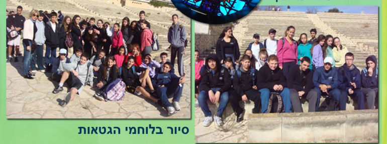
סיור בלוחמי הגטאות

מדעים-העשרה-הרצאות וסיורים לימודיים * סיור ל"שדות ים"-בחוף הים, איסוף וחקר בע"ח. * הרצאה "אבולוציה ודינוזאורים". * השתתפות פעילה "ביחידה לנוער שומר מדע" בטכניון בנושאים: חקר אור וצבע, סבונים ודטרגנטים, חוש טעם וריח.