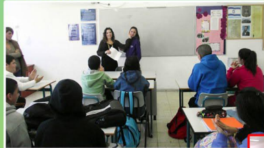
הרצאה של תובעת משפטית