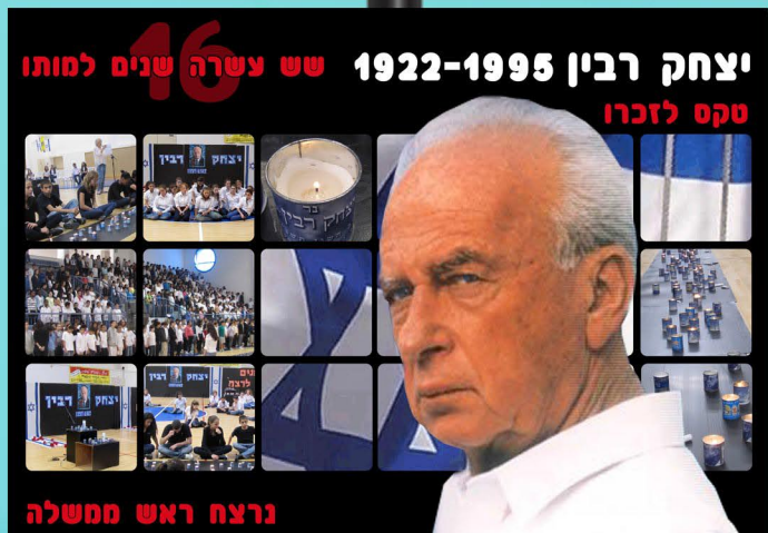
נרצה ראש חמשה