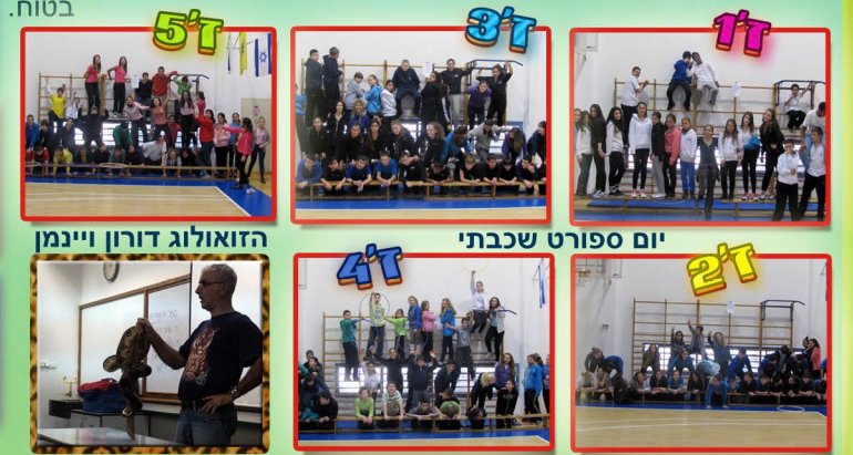
11 יום ספורט שכבתי 12 יום ספורט שכבתי 13 יום ספורט שכבתי 14 יום ספורט שכבתי 15 יום ספורט שכבתי 16 יום ספורט שכבתי 17 יום ספורט שכבתי 18 יום ספורט שכבתי 19 יום ספורט שכבתי 20 יום ספורט שכבתי 21 יום ספורט שכבתי 22 יום ספורט שכבתי 23 יום ספורט שכבתי 24 יום ספורט שכבתי 25 יום ספורט שכבתי 26 יום ספורט שכבתי 27 יום ספורט שכבתי 28 יום ספורט שכבתי 29 יום ספורט שכבתי 30 יום ספורט שכבתי 31 יום ספורט שכבתי

* ערב הורים-הצגת המבנה הארגוני, חזון ויעדי ביה"ס. * הרצאה "אינטרנט בטוח" גלעד האן. * מפגש היכרות-הורה-מורה-תלמיד. * אסיפות הורים כיתתיות עם 2 המחנכות-תוכנית הלימודים הבית ספרית. * שנת בר/בת מצווה * הנחיה בנושא: "עבודת שורשים". * טקס הכרזה על שנת בר המצווה וצפייה בהצגה "אסונות וניסים". * ערב קהילתי-בנושא: "השבת". * "מבצע יונתן" הרצאה וסרט לתלמידי השכבה. * הרצאה בהצגה: "מלחמת יום הכיפורים". * צפייה בהצגה: "מכתבים לאחי" בתיאטרון מוצקין. * טל"מ-טיפוח לימודי מזרחנות-משחקי "פיצוחים" בנושא המזרח התיכון, במסגרת לימודי הערבית. * של"ח: גיחה ליומיים ל"אכזיב"-בסימן "מעורבות וסבלנות". * ימי שדה: נחל שיח-הכרמל-עשייה למען היערות לאחר השריפה, גן הנדיב. * "מתים לחיות" בע"ח-מפגש חווייתי של תלמידי הכתה עם הזואולוג, דורון ויימן. * "מילונאות" ובבליוגרפיה-ביקור בספרייה העירונית הרצאה וסדנא בנושא "יומנת" ביום חלוקת התעודות בסימן: "אורח חיים בריא ופעיל". * יום ספורט חווייתי לגיבוש שכבת-תחרות בין הכיתות-תחנות ואטרקציות ספורט. * "חממה בין דורית"-סבים וסבתות ב"למדיה ירוקה". * תכניות ייעוציות * אקלים כיתה, "מעברים", צמצום אלימות, מניעת סמים ואלכוהול, אינטרנט בטוח.