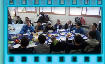
ארוחת בוקר בכיתות