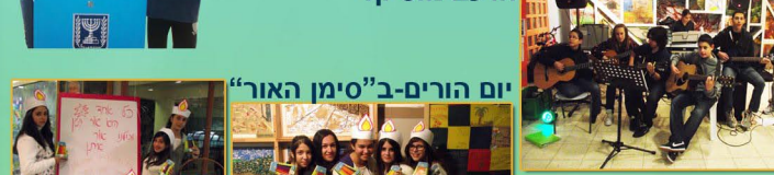
יום הורים ב"סימן האור"