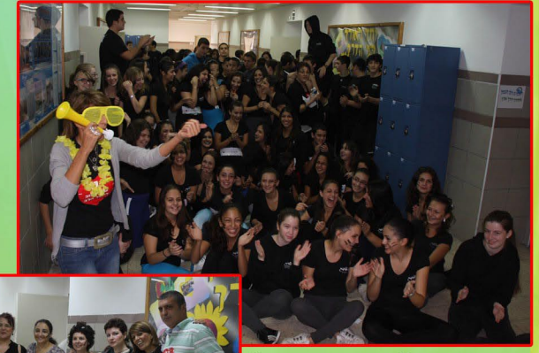
"הפנינג בריאות" בית ספרי בשיתוף הקהילה

* דרכי התמודדות עם כעסים-מניעת אלימות, מניעת עישון, סמים ואלכוהול, אינטרנט בטוח. * "סיפורי אלכוהול" הצגת יחיד המדגישה את הסכנות הטמונות בגיל ההתבגרות בכלל ובשתיית אלכוהול בפרט. * תוכנית "מעברים" -תהליך קבלת החלטות (לקראת בחירת מסלולי למידה בתיכון).