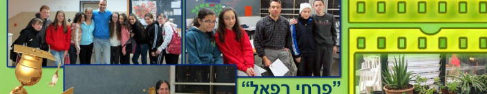
מכירת נרות כתרומה למען העיוור