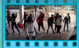
הפסקה פעילה-ריקודי זומבה