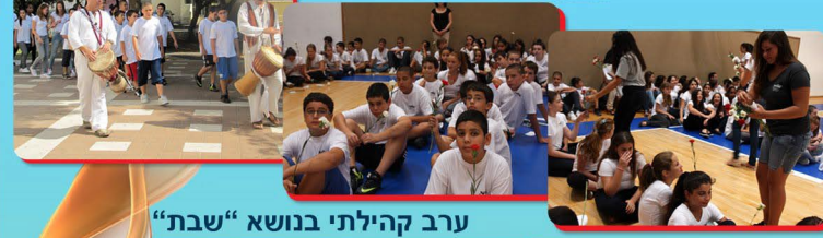
ערב קהילתי בנושא "שבת"