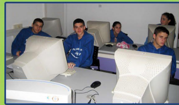
קורס "חקר מדעי" בטכניון

"אורטכניון"-תגבור לימודי במתמטיקה באנגלית * התמודדות עם לחץ לימודי, תכנון זמן, אורור רגשות-בהנחיית יועצת השכבה. * קורס "חקר מדעי"-הכנה לקורס האקדמי הראשון "מבוא לביולוגיה".