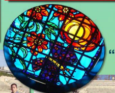
"כי פרפרים אינם חיים בגטו" פאבל פרידמן