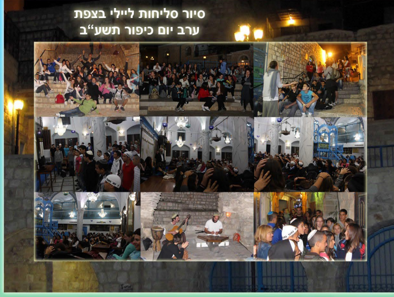
סיור סליחות ליילי בצפת ערב יום כיפור תשע"ב