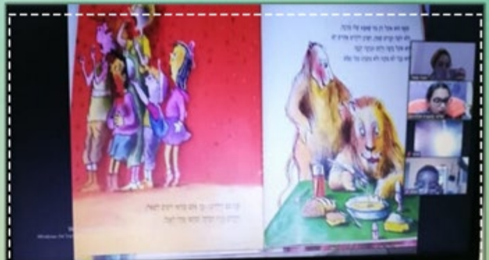
מועצת תלמידים מקריאה סיפור לכיתות א'