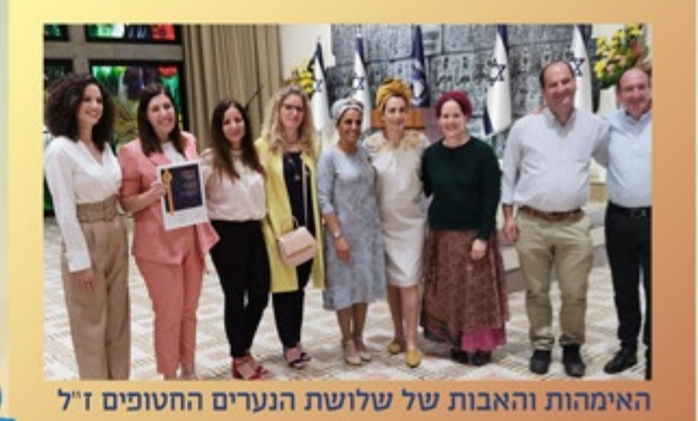
האימהות והאבות של שלושת הנערים החטופים ז"ל