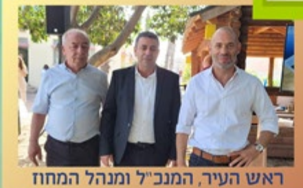
ראש העיר, המנכ"ל ומנהל המחוז