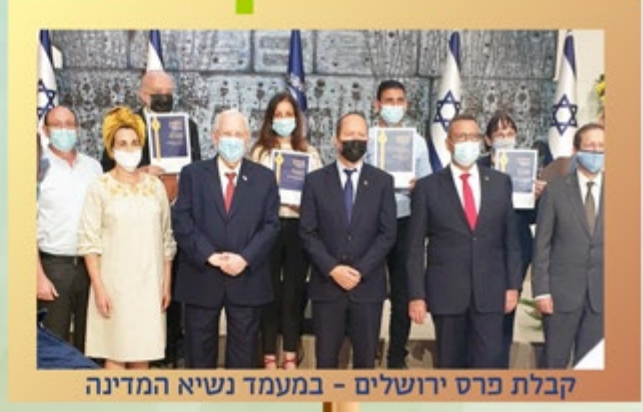
קבלת פרס ירושלים - במעמד נשיא המדינה