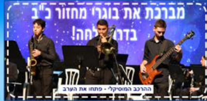
מברכת את בוגרי מחזור כ"ב בדרך צלחה! הרכב המוסיקלי - פתחו את הערב