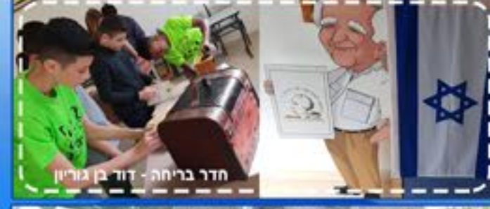
חדר בריחה - דוד בן גוריון