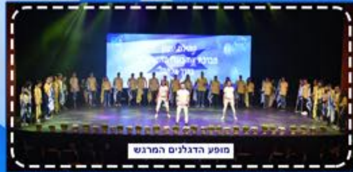
מופע הדגלים המרגש