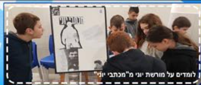
לומדים על מורשת יוני מ"מכתבי יוני"

"בל נתפשר עם פחות מהטוב ביותר האפשרי וכאשר נדמה