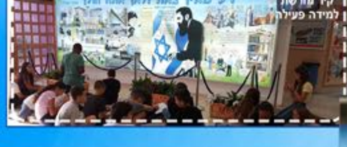
קיר מורשת למידה פעילה