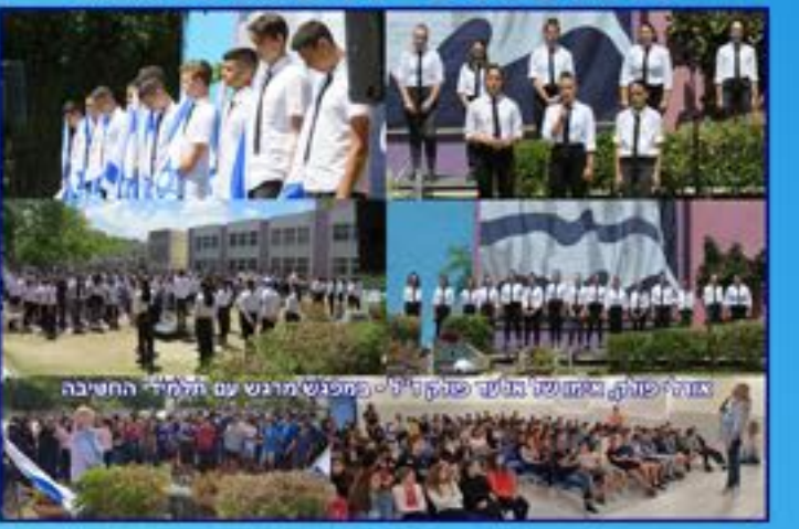
ישראל תשע"ט - 71 שנות עצמאות