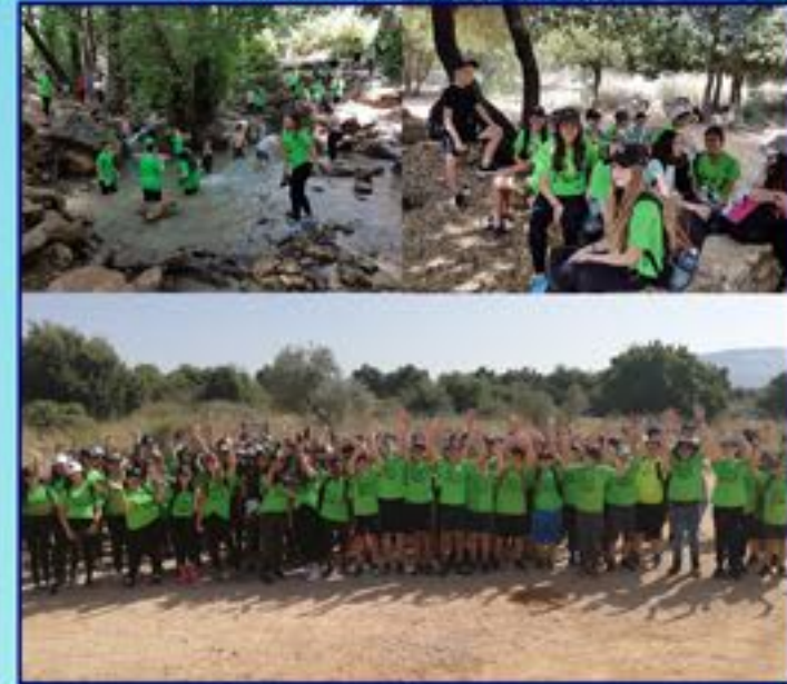
מסע שכבת ח' -בליל עליין