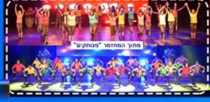
מתוך המחזור "מונתקים"