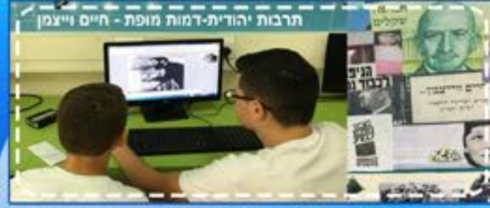
תרבות יהודית-דמות מופת - חיים וייצמן