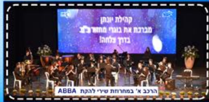
קהילת יונתן מברכת את בוגרי מחזור כ"ב בדרך צלחה