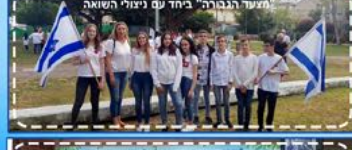
מצעד הגבורה" ביחד עם ניצולי השואה