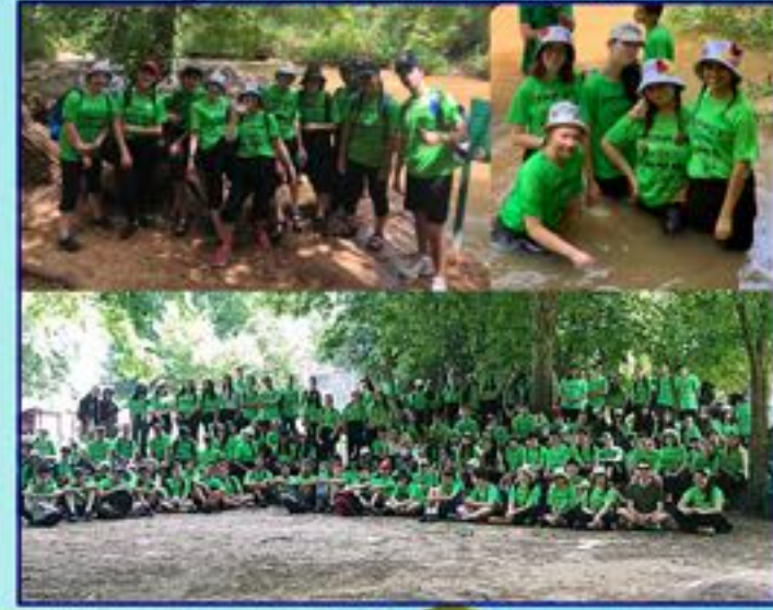
מסע שכבת ט' -רמת הבולן