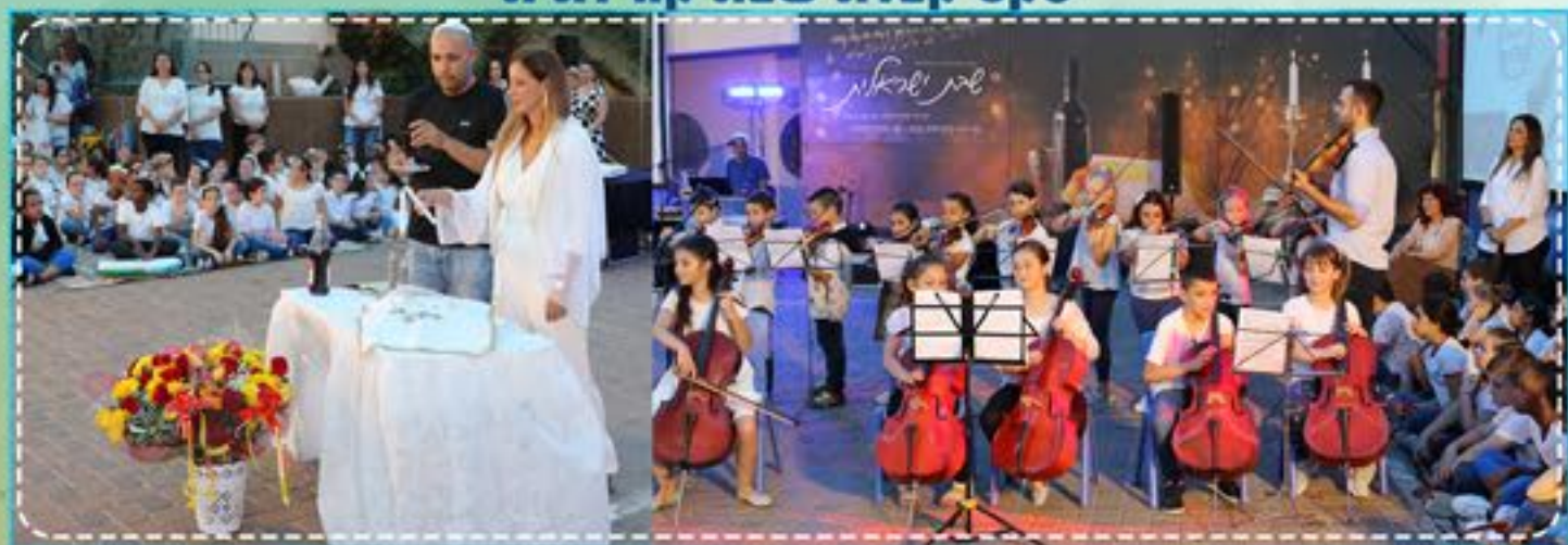
ביקור מנכ"ל משרד החינוך ומנהל המחוז (כתבה עמוד 2)